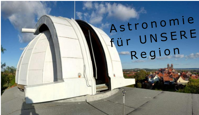
Quedlinburg - UNESCO Welterbestadt

Hier investiert Europa in die Zukunft unseres Landes